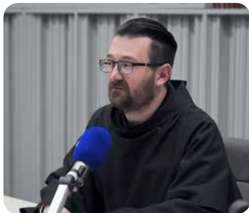
fra Ivan Marija Lotar

Izbor tema emisija i gostiju u emisiji pušten je urednicima i voditeljima. Odabrane su teme vrlo raznolike. Odras su preferencija urednika i aktualne situacije u Crkvi i u društvu. (HRK)