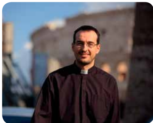
p. Mislav Skelin